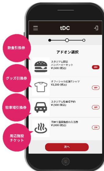
アドオン販売インターフェース例

チケット購入の際、当日の飲食引換券や来場者限定グッズなどを同時に購入できるように設定することができます。在庫引き当ての機能があり、興行主は事前に需要量を正確に把握することができます。